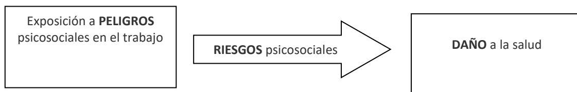
Figura 1. Peligro, riesgo y daño [EU-OSHA: Drivers and barriers for psychosocial risk management («Los factores que favorecen y los factores que obstaculizan la gestión de los riesgos psicosociales»), adaptado de Cox, 1993 x ].

Por otra parte, cada vez se constata con más intensidad la relación entre los trastornos musculoesqueléticos y los riesgos psicosociales. Por ejemplo, los trabajadores pueden trabajar sin hacer descansos o padecer tensiones musculares debidas al estrés, lo que puede provocar trastornos musculoesqueléticos.